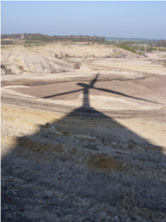
Foto: Windkraft- rad am Tagebau (c) Julian Nitz- sche/ pixelio.de

1 Das Konzept finden Sie hier: http://www.agora-energiawende.de/fileadmin/Projekte/2014/Kohledialog/01_Graichen_Praesentation_13_012016.pdf