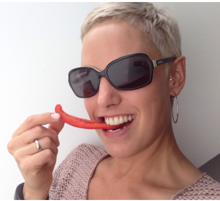
Foto oben rechts: Wenn man öfter Fleisch gegen fri- sches Gemüse oder Fleischalter- nativen ersetzt, kann man der Umwelt etwas Gu- tes tun.